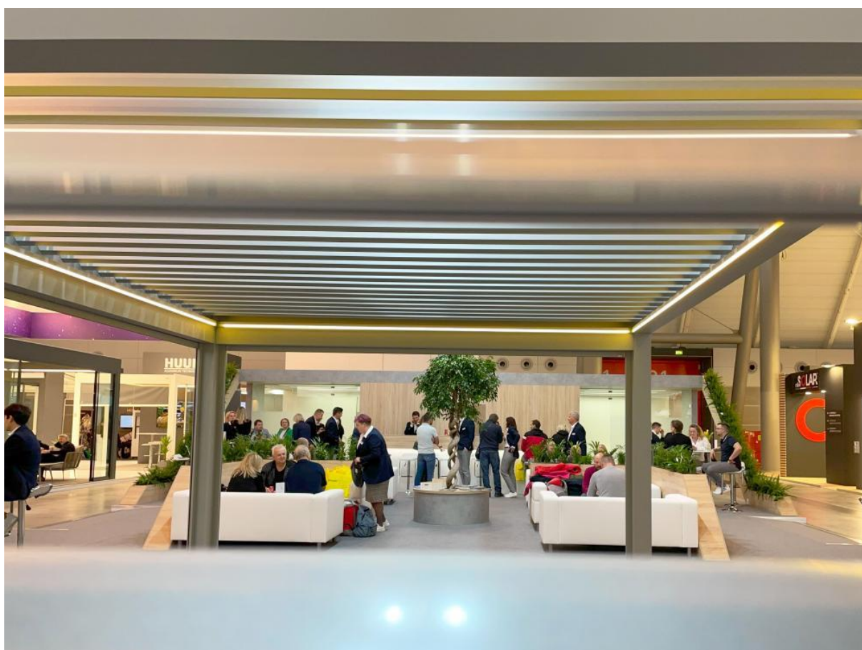
CLIMAX na veletrhu R+T ve Stuttgartu.

Stínící technika má svůj veletrh. Ten letošní R+T ve Stuttgartu se konal po 6leté vynucené pauze a my se ho mohli konečně účastnit. Pokud si někdo klade otázku, co zajímavého se ve světě stínění děje, odpověď je následující – nenápadný luxus, kvalita a ekologické inovace.