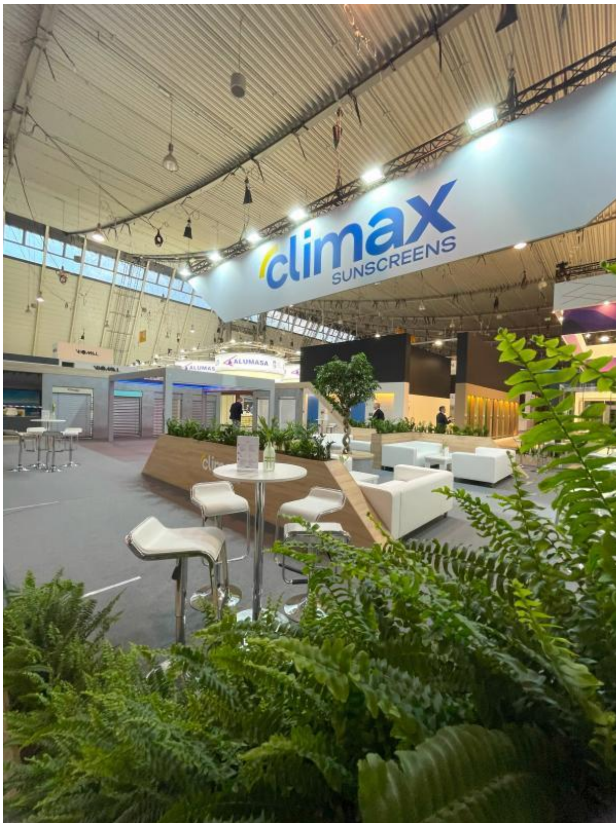
CLIMAX na veletrhu R+T ve Stuttgartu.