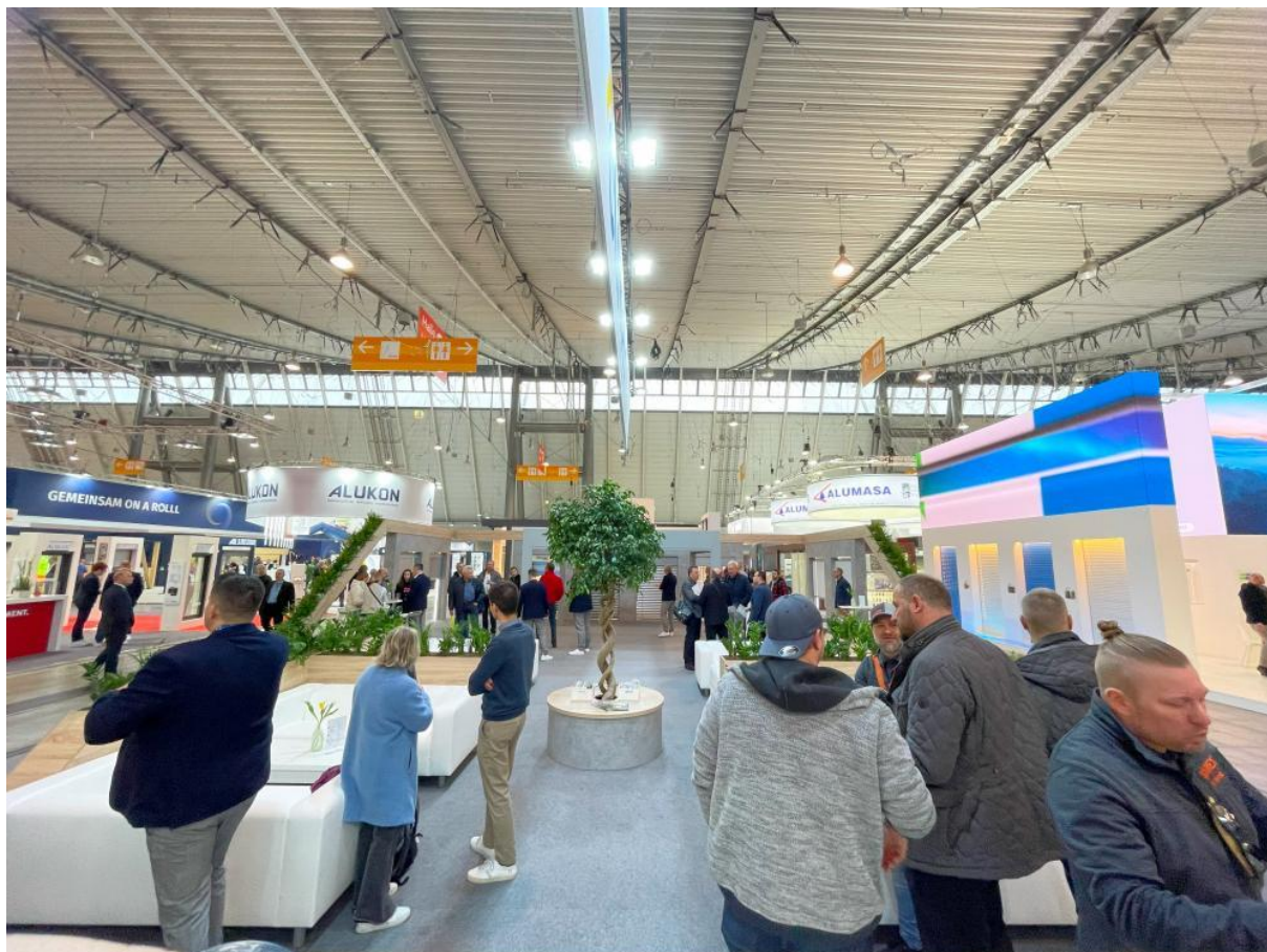
CLIMAX na veletrhu R+T ve Stuttgartu.

Není to poprvé, co musíme zmínit – není stín jako stín. Skutečně kvalitní stínění a jeho správné použití dokáže nahradit i chladicí zařízení. A ještě k tomu izoluje okna, chrání soukromí nebo odhlučňuje venkovní ruch. Tyhle výhody my z oboru již známe. Veletrh měl proto za cíl nastínit nejnovější trendy.