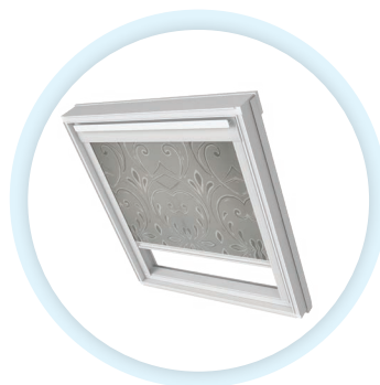
FANTAZIE roletka do střešních oken